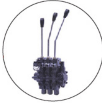
메뉴얼 밸브 (수입 P사)