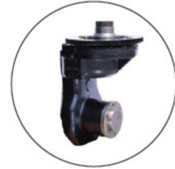
구동 감속기 (국내 G사)