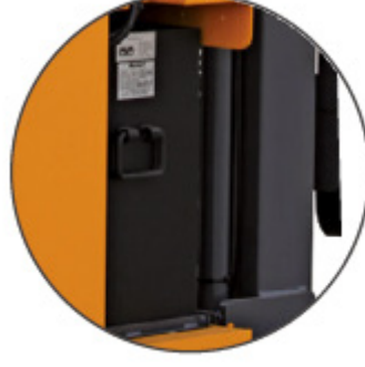
배터리 (국내 S사)