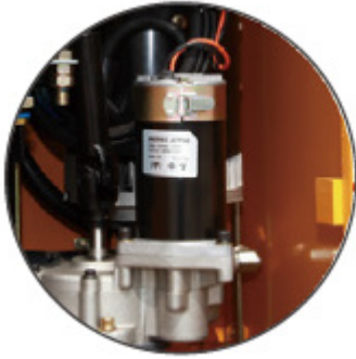
전자식 파워스티어링 (국내 R사)