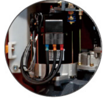
AC 구동 모터 (국내 P사)