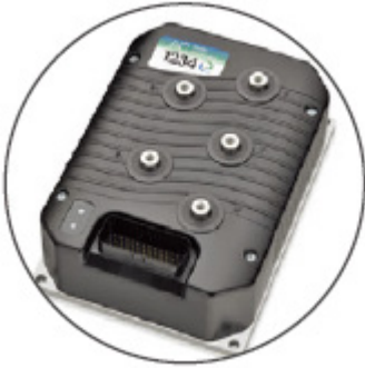
컨트롤러 (수입 CURTIS사)