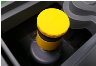
폐수탱크의 개구부가 넓어 탱크 청소 및 필터관리가 용이