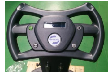
간편한 조작버튼으로 누구나 손쉽게 작동 가능