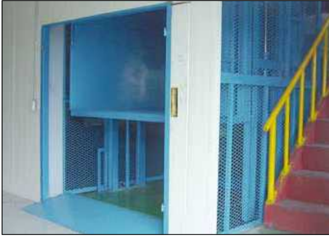
▼ 1층모습-TWO MAST Type