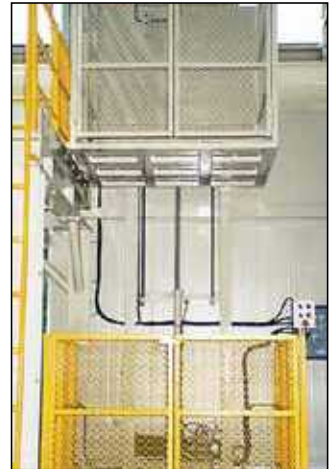
▼ 준2층용 리프트