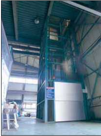
▲ 자동도어 장착 및 외부마감