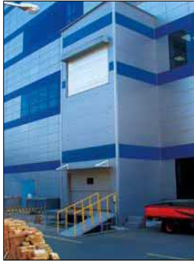
▲ 외부마감-아이슬판넬 마감

작은통로에 설치 가능하고, 별도의 기계실이 필요 없습니다. 유지보수가 적으며, 현장 조건에 따라 PIT없이 설치 가능하다.