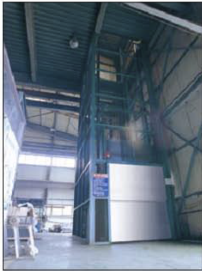
▲ 자동도어 장착 및 외부마감