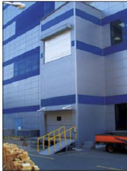
▲ 외부마감-아이슬판넬 마감

작은통로에 설치 가능하고, 별도의 기계실이 필요 없습니다. 유지보수가 적으며, 현장 조건에 따라 PIT없이 설치 가능하다.