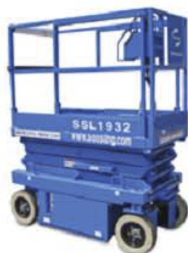
◀ 일본-렌탈업체 수출장비 SSL-1932/5.8m/227kg