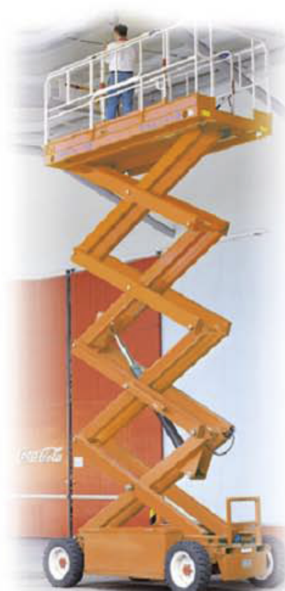
코카콜라 사용현장 ▶ SSL-3370/10m/600kg