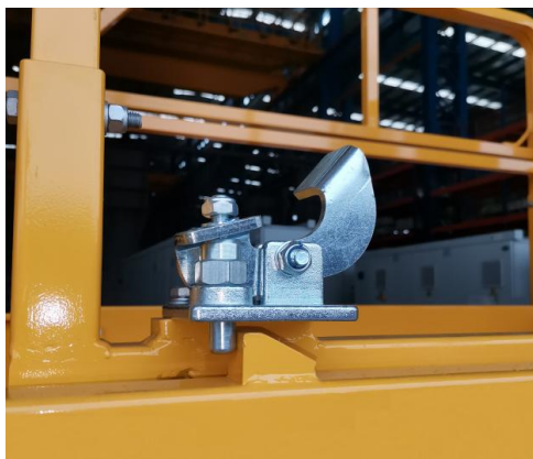
연장 작업대 스톱퍼