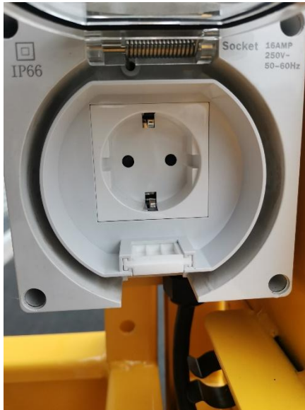
상부 AC 콘센트