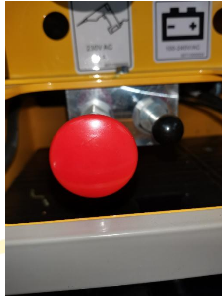
브레이크 수동 해제