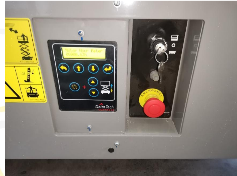
Delta Tech 조작판넬 및 비상정지 버튼 (하부)