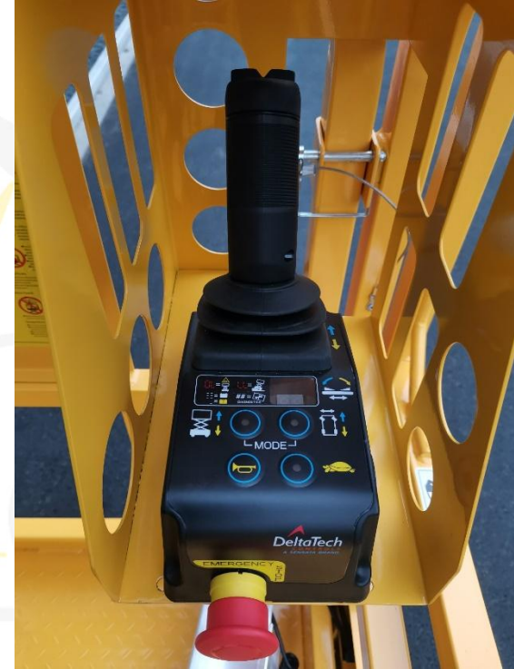
Delta Tech 일체형 조이스틱