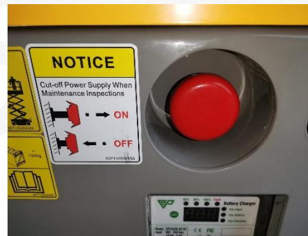
비상하강 밸브 (하부)