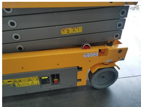
측면 알림 (부저)