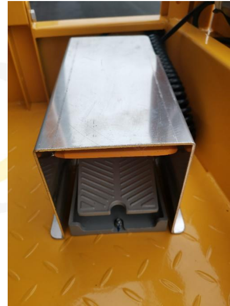
안전 풋 스위치